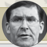
مارک اسپر وزیر دفاع آمریکا از سال ۲۰۱۷

اگر ایران مأمور سابق FBI را که از ۱۲ سال پیش در این کشور مفقود شده به آمریکا بازگرداند، گام بسیار مثبتی خواهد بود؛ از سوی دیگر، طبق اطلاعات و باور ما، ایران (از گذشته) در حال غنی‌سازی اورانیوم بوده و در حال حاضر نیز است که این، یک گام بسیار بدی خواهد بود.