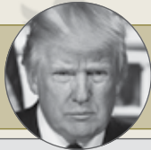
دونالد ترامپ رئیس‌جمهور آمریکا

رئیس‌جمهور، وزیر امور خارجه، وزیر دفاع و برخی از مقامات دولتی ایالات متحده آمریکا، در کنار نمایندگان کنگره این کشور، طی یک ماه گذشته (از ۲۰ مهرالی ۲۰ آبان ماه ۱۳۹۸)، موضع‌گیری‌های مختلفی در حوزه‌های هسته‌ای، تحریم، حضور منطقه‌ای و مواردی از این دست، علیه ایران در توییت داشته‌اند که در ادامه به برخی از مهم‌ترین موارد آن اشاره می‌شود.