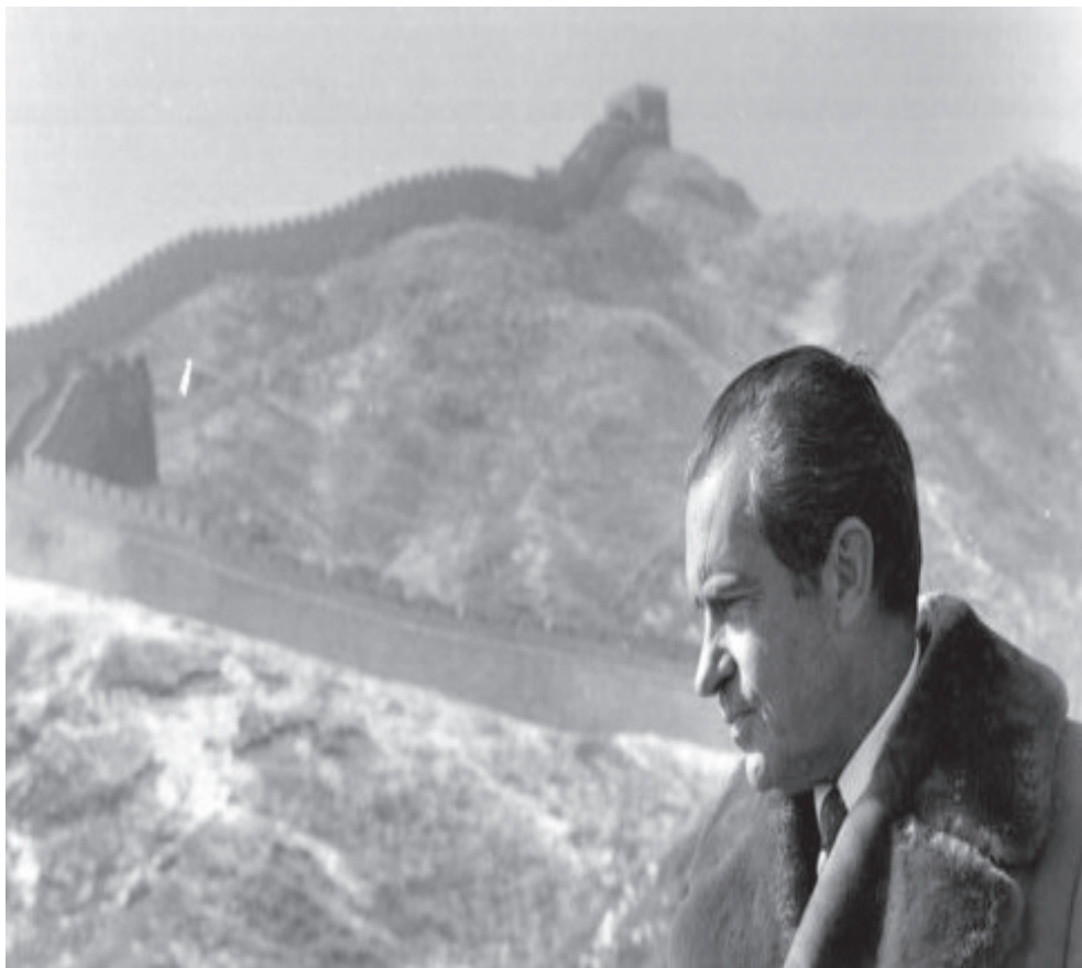
پرزیدنت نیکسون در نزدیکی دیوار بزرگ چین در سال ۱۹۷۲

چین را به حالت تعلیق درمی آورد. در ژوئن ۲۰۱۵، مقامات آمریکایی می گویند که شواهدی وجود دارد مبنی بر اینکه هکرهای چینی مسئول افشای بزرگ اطلاعات دفتر مدیریت کارکنان ایالات متحده و همچنین، سارق اطلاعات ۲۲ میلیون کارمند فعلی و سابق دولت فدرال هستند.