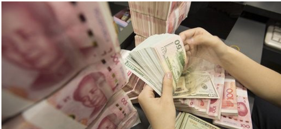
یک کارمند بانک دلار آمریکا و یوان چین را می شمارد

تمامی شهروندان غیر آمریکایی که اخیراً به جمهوری خلق چین سفر کرده اند، می شود. در ماه مارس، سازمان بهداشت جهانی بعد از سرایت کرونا به بیش از 100 کشور، آن را یک همه گیری جهانی اعلام می کند. این مسئله باعث می شود تا مسئولان چینی و آمریکایی، هر کدام دیگری را مسئول این بیماری خطاب کنند. سخنگوی وزارت خارجه چین بدون ارائه هیچ مدرکی مدعی می شود که ارتش آمریکا این ویروس را وارد چین کرده، در حالی که ترامپ، بارها از «ویروس چینی» یاد کرده و اظهار می دارد که گسترش این ویروس، به دلیل ناتوانی دولت چین بوده است. در ماه آوریل، مقامات ارشد هر دو کشور لحن خود را تغییر داده و در دوران مواجهه جهان با این بحران، بر همکاری های مشترک تأکید می کنند؛ اما همچنان ترامپ از سازمان بهداشت جهانی