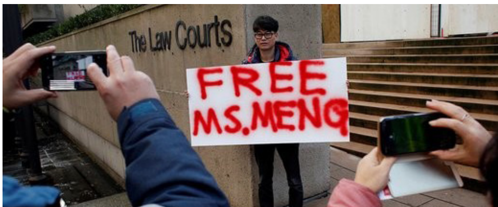
مردی تابلویی را در بیرون دادگاه کانادا در جریان جلسه دادگاه منگ وانژو نگه می‌دارد

به واسطه افزایش تنش‌های دیپلماتیک، چین و آمریکا، کنسولگری‌های خود را تعطیل می‌کنند ایالات متحده آمریکا به چین دستور می‌دهد تا کنسولگری خود