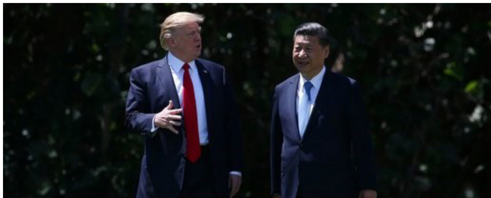
ترامپ و شی در فلوریدا دیدار کردند.

ترامپ قانون حقوق بشرودموکراسی هنگ‌کنگ را بعد از تصویب در