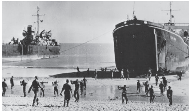
سربازان ملی گرای چینی مهمات را در کوهنمای تخلیه می‌کنند.

در فوریه 1972، رئیس‌جمهور ریچارد نیکسون، هشت روز را در چین می‌گذراند و در طول این مدت، با رهبر مائوتسه ملاقات کرده و تفاهم‌نامه همکاری مشترک دو کشور را با نخست‌وزیر جئوئن لای امضاء می‌کند. این توافق زمینه‌ساز بهبود روابط چین و آمریکا است، زیرا براساس آن، چین و ایالات متحده