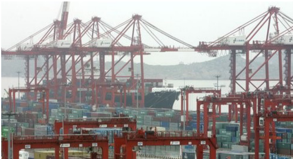
بندری در شانگهای

کلاه‌برداری متهم کرده و خواستار استرداد او می‌شود. چین نیز در اقدامی متقابل دو شهروند کانادا را به جرم اقدام علیه امنیت ملی دستگیر می‌کند. مقامات چینی دستگیری منگ را یک «اتفاق سیاسی مهم» خوانده و خواستار آزادی فوری او می‌شوند. آمریکایی‌ها تأکید می‌کنند که محاکمه این