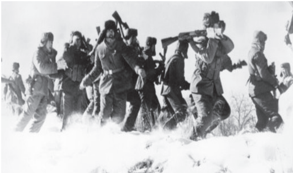
سربازان چینی در نزدیکی مرز شوروی مستقر شدند.

شرکت گلدمن ساکس، چین تلاش می‌کند تا جایگاه آمریکا به عنوان اقتصاد اول جهان را در سال 2027 از آن خود کند. بر اساس گزارشی که چینی‌ها در ابتدای سال 2011 منتشر می‌کنند، میزان تولید ناخالص داخلی این کشور در سال 2010، به 5.88 تریلیون دلار رسیده، در حالی که این رقم برای ژاپن، 5.47 تریلیون دلار است.