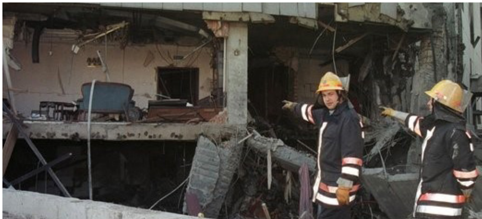
سفارت چین در بلگراد پس از اصابت موشک های ناتو

تلویزیون و دستگاه های پزشکی، با تعرفه ی واردات 25 درصدی مواجه خواهند شد. چین نیز در مقابل، بر بیش از 500 محصول آمریکایی تعرفه وضع می کند. این اقدام شامل کالاهایی به ارزش نزدیک به 34 میلیارد دلاری شود، محصولاتی مانند گوشت گاو، لبنیات، غذاهای دریایی و سویا. ترامپ و کابینه او معتقدند که چین با سوء استفاده از قوانین تجارت آزاد، تلاش دارد تا ایالات متحده