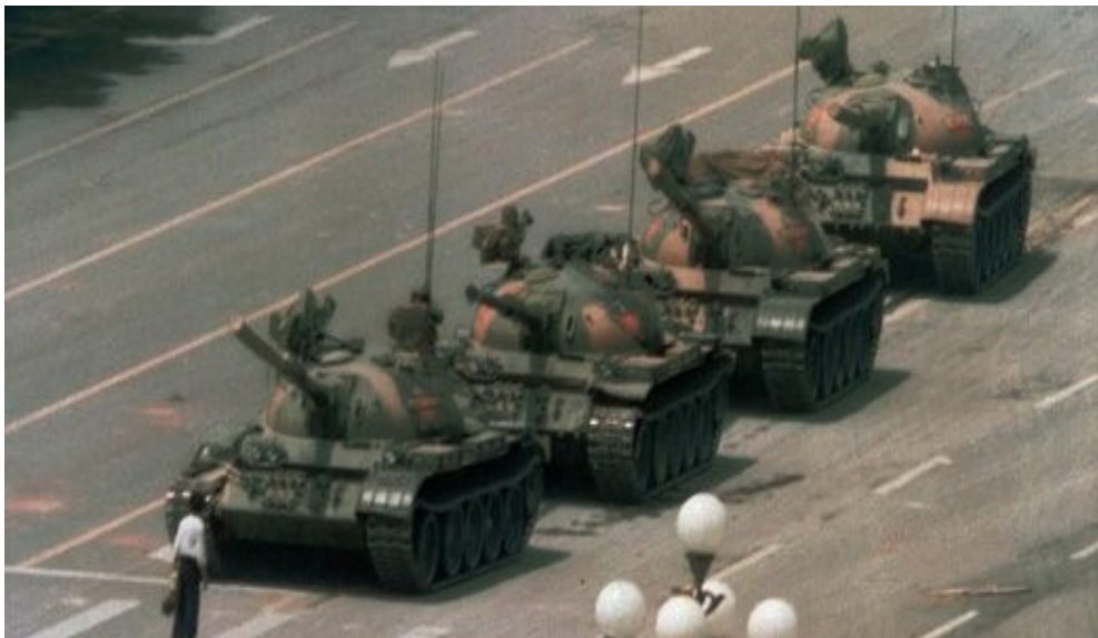
یک معترض تنها با تانک‌های نظامی در میدان تیان آن من روبرو می‌شود.

دونالد ترامپ در تماس تلفنی با رئیس‌جمهور چین، می‌گوید که او از سیاست چین واحد حمایت می‌کند. ترامپ بعد از رسیدن به ریاست جمهوری برخلاف رسم معمول، تلفنی با رئیس‌جمهور تایوان، سای اینگ-ون گفتگو کرده و پایبندی آمریکا به سیاست چین واحد را زیر سؤال می‌برد.