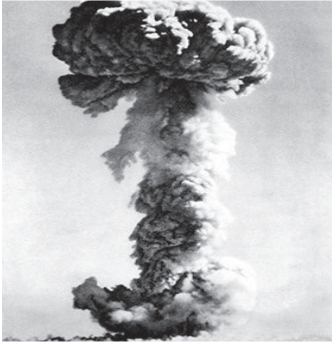
آزمایش اتمی چین در صحرای گوبی استان سین کیانگ

طی یک سخنرانی مسئله تعامل و گفتگوی راهبردی با چین را مطرح می‌کند. او در حالی که پکن را یک قدرت نوظهور می‌خواند، از این کشور می‌خواهد تا به عنوان یک «سهامدار مسئول» عمل کرده و از نفوذ خود برای کشاندن کشورهایمانند سودان، کره شمالی و ایران به سمت پایین‌بندی به نظام بین‌الملل استفاده کند. در همان سال، کره شمالی از گفتگوهای شش جانبه‌ای که با هدف کنترل و محدودسازی جاه‌طلبی‌های هسته‌ای این کشور برگزار می‌شد، خارج می‌شود. بعد از اینکه کره شمالی اولین آزمایش هسته‌ای خود را در اکتبر 2006 انجام می‌دهد، چین نقش میانجی را ایفا کرده و تلاش می‌کند تا پیونگ‌یانگ را به میز مذاکرات بازگرداند.