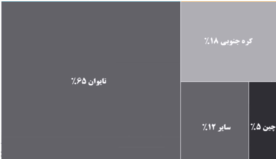
تصویر شماره (۱) میزان سهم شرکت‌های تایوانی از صنعت تراشه جهان

دلاری را برای تقویت این صنعت، تصویب کرده است).